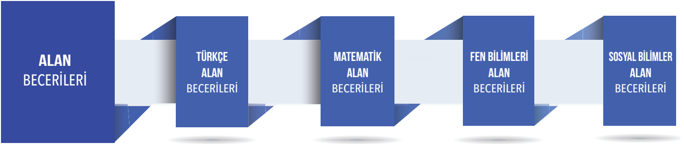
İnfografik: Alan Becerileri

Becerilerin süreç boyunca kullanılması bağlama dayalı bilgi kümelerini gerektirmektedir. Beceri gelişimini modellemede ve anlamlandırmada becerilerin soyutlanması ve bilgi ile birlikte yorumlanması önem taşımaktadır. Alan becerileri; kavramsal becerileri ve/veya alana özgü bütünleşik becerileri kapsayacak şekilde yapılandırılmıştır. Bu yönüyle alan becerileri, kavramsal becerileri ve/veya alana özgü bütünleşik becerileri kapsayan ve bu becerilerin süreç bileşenlerini de içeren yapılardır.