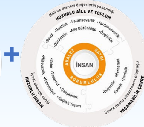
ERDEM DEĞER EYLEM MODELİ